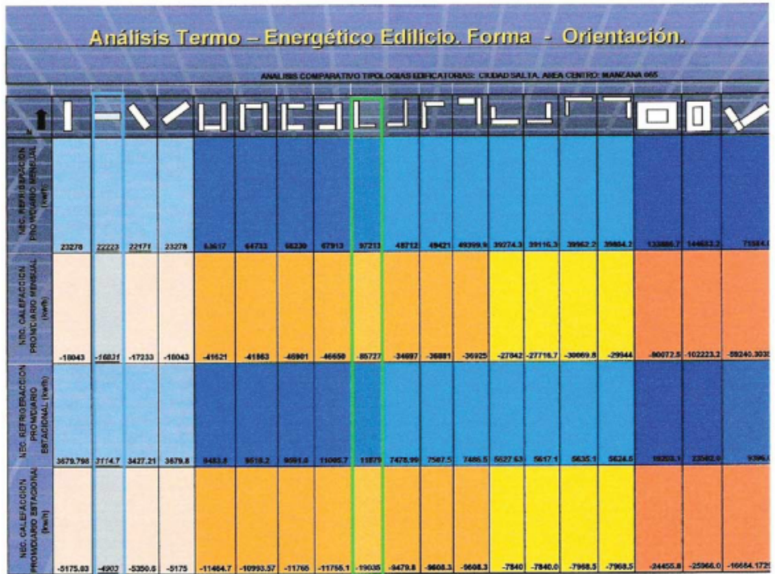
Gráfico comparativo: indicadores energéticos – morfológicos – emplazamiento/orientación (N) Mayor eficiencia ■ Eficiencia Intermedia ■ ■