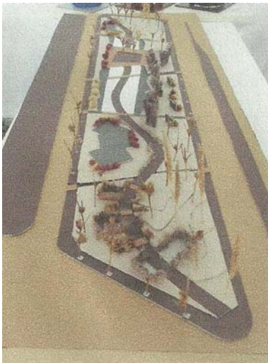
El agua vincula y caracteriza el proyecto

En este proceso, el trabajo se divide en etapas diferentes que permiten llevar a cabo un planeamiento detallado y abarcar todos los aspectos del desarrollo creativo. De esta manera, se logra un óptimo resultado. Los pasos para el planeamiento del espacio son básicamente dos: relevamiento, desarrollo de diseño. El primero consiste en la recopilación de toda la información del lugar, como medidas, topografías, límites y bordes visuales, orientación, tipo de