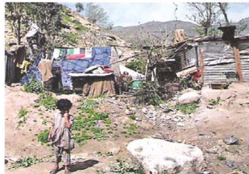
Figura 5. Situación actual trabajo y habitación, ciudad de Salta. Falta trabajo, habitación y cobijo.