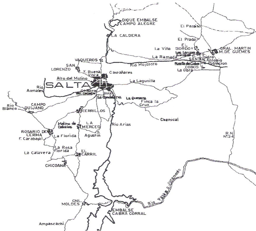
Figura 2. Salta hacia el Siglo XVIII (tomado del del libro Salta, IV Siglos de Arquitectura y Urbanismo ).

Se inventó, entonces, la institución que defendía el poblamiento de América: la encomienda. El encomendero, que en adelante sería casi un señor feudal, armó fincas y caseríos o poblados; manejaba un grupo de familias aborígenes proporcionándole el bienestar mínimo y la salvación de sus almas, no podían ser vendidos, no eran esclavos ni podían ser trasladados, pero a cambio el natural trabajaba - producían maíz, frutas, hortalizas, alimentos