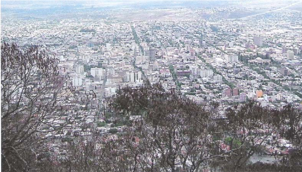
Figura 4. Fotografía actual de la ciudad de Salta.