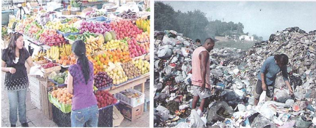
Figura 7. Consumo y desechos, ciudad de Salta. Dos caras de la misma moneda.

revende dentro del mercado de la basura.