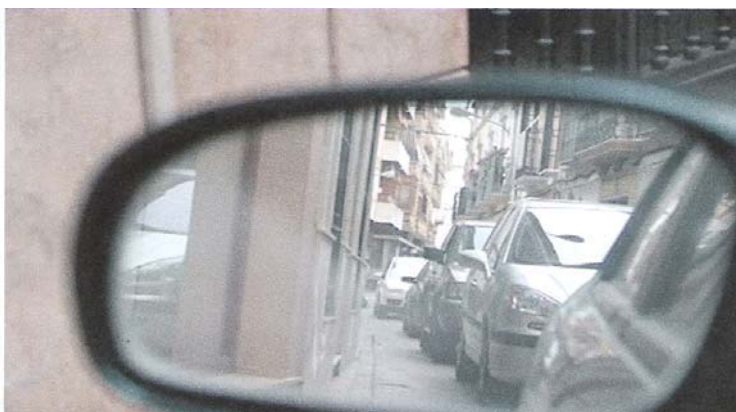
Figura 6. Situación actual parque automotor, ciudad de Salta. Las calles y veredas quedaron estrechas y riesgosas.

Se tiran alrededor de 600 toneladas de basura por día y esto viene creciendo en los últimos siete años, desde el 2002, y tiene picos durante la época de fiestas. Del total, sólo en plástico y papel hay 180 toneladas por mes. Cabe destacar que cuando los camiones recolectores llegan al basural San Javier, los clasificadores se agolpan para recoger todo material que se