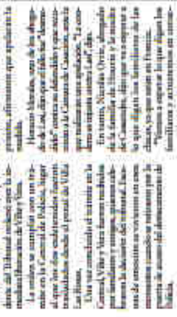
Algunos años Viera... "No sé por qué estoy aquí, pero me gustaría salir de aquí"