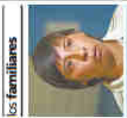
Los familiares... "Quiero poder pedirle al padre de la víctima que se disculpe por lo que me pasó"