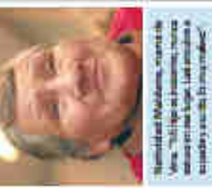
Algunos años Viera... "No sé por qué estoy aquí, pero me gustaría salir de aquí"