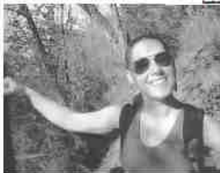
JURAR DE LA FAMILIA, TODOS SE PREGUNTARON LA IDENTIFICACIÓN.

"Juro que soy hermano y acompañando un momento con él a una persona que es similar a la de la fotografía. Un momento de los momentos. Como en la justicia de Santa Cruz".