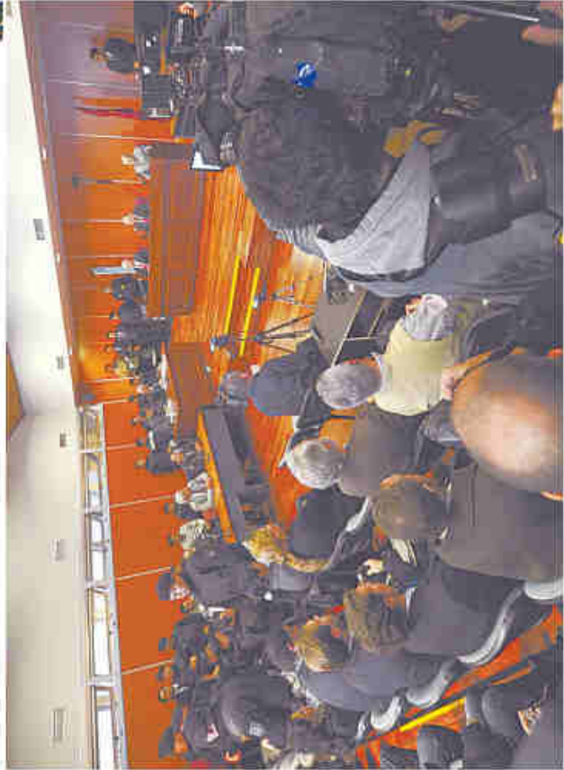
El día viernes con la presencia del juez de Casimiro...