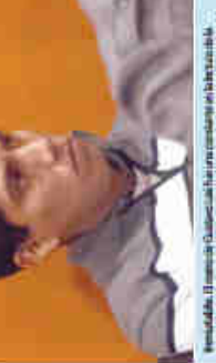
Algunos años Viera... "No sé por qué estoy aquí, pero me gustaría salir de aquí"