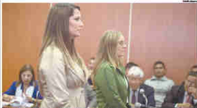
ESTRADA LAS FISCAL CORRALO Y BALBUENA TERMINA DE SU DECLARACIONES.

ser ellas”, declaró el jurado. “El primer testimonio es el más sorprendente y yo creo en lo que contó muy crítico”, expresó Bouvier. Frente a lo expresado, el ciudadano francés dejó entender que está listo para más cuestionamiento de que las víctimas no fueran muertas y atrapadas en la zona de El Mirador, sino en otros lugares.