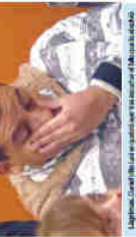
Algunos años Viera... "No sé por qué estoy aquí, pero me gustaría salir de aquí"