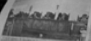
El jurado que juzgará a los militares involucrados en los delitos de la dictadura.