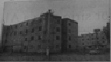
El complejo habitacional donde ocurrió el accidente que costó la vida de una niña.