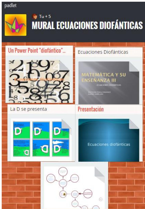
Figura 1- Mural sobre ecuaciones diofánticas

estudiantes universitarios, pueden manejar mejor la información y el trabajo individual, inclusive el hecho de hacer una puesta en común online. A la vez, que es una práctica que les servirá para toda su carrera. La implementación de la secuencia llegó a este punto solamente. Lo siguiente a realizar, será trabajar con los estudiantes en la clase presencial y en el grupo de Facebook, una serie de problemas vinculados a la utilización de las ecuaciones diofánticas en su resolución. Se decidió comenzar con una serie de problemas, porque a raíz de los diferentes trabajos realizados por los alumnos, resultará de mucho mejor aprovechamiento para su aprendizaje.