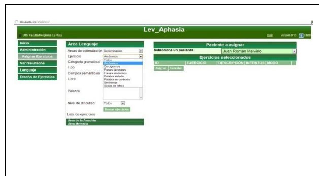
Figura 4. Página de asignación de ejercicios.

Una vez que haya ingresado a su cuenta, y ya en la pantalla “Página de inicio del usuario terapeuta”, podrá ver la cantidad de ejercicios que tiene que revisar de cada uno de sus pacientes, ver cuáles son sus pacientes que han estado realizando ejercicios recientemente, y acceder a diferentes módulos: el de administración, el de asignación de ejercicios, el de visualización de resultados, el del lenguaje, el de diseño de ejercicios y el de evaluación (ver Figura 3).