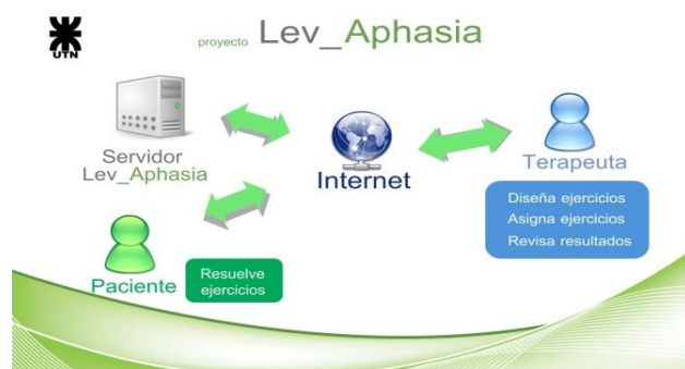
Figura 1. Estructura de la telepráctica.

El DCU se aplicará en lo inmediato, en la mejora de la IU, y usaremos CA para una adecuada recolección de las necesidades para luego obtener los requerimientos para el diseño.