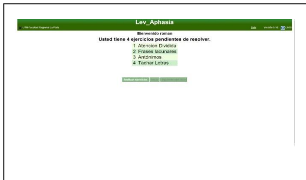
Figura 5. Página de inicio del usuario persona afásica.

Una vez seleccionados, el paciente podrá ver de la “Página de inicio del usuario persona afásica” los ejercicios que tiene que realizar, cuyos resultados podrán ser revisados luego por el terapeuta (Ver Figura 5).