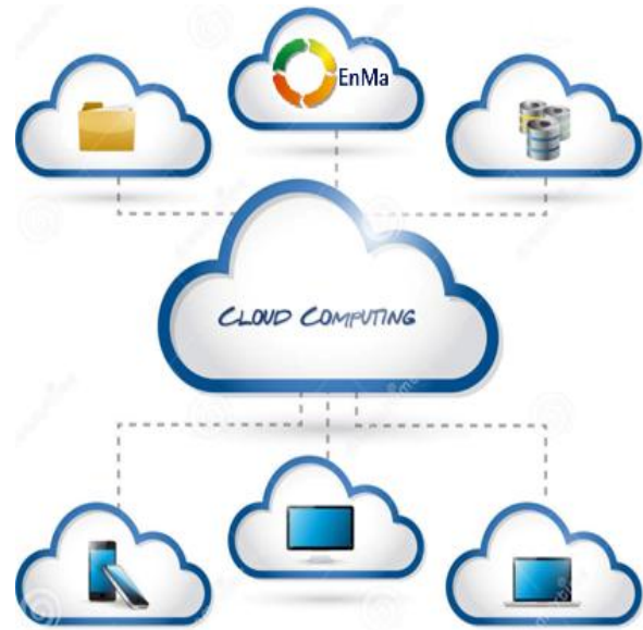
Figura 2. Arquitectura Cloud Computing aplicada a EnMa Tool.

Todo el desarrollo opera bajo el paradigma Cloud Computing (computación en la nube), es decir, como un servicio que se brinda a través de servidores en Internet, lo cual permite a EnMa atender peticiones en cualquier momento y desde cualquier dispositivo (móvil o fijo) ubicado en cualquier lugar, mientras que tenga acceso a Internet y un navegador web.