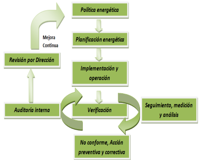
Figura 1. Modelo del sistema de gestión energético propuesto por la ISO 50001.

La norma de sistemas de gestión de energía trabaja sobre un proceso PDCA (Plan, Do, Check, Act = planificar, hacer, verificar, actuar), a la vez que propone un ciclo de mejoramiento continuo en el cual se establece una realimentación constante en base a los datos relevados de la verificación (Figura 1)