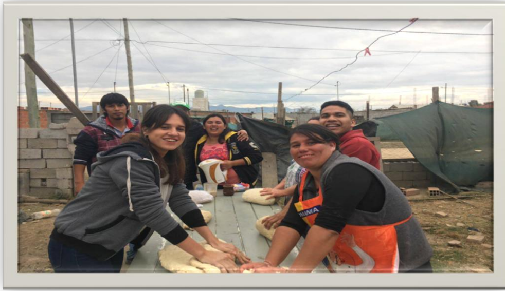
Comisión de la realización del pan para los niños. Atocha I.