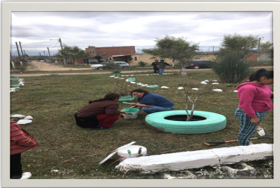
Actividad de resignificación de la plaza. Atocha I.