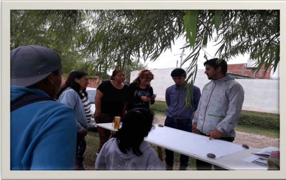
Legitimación del proyecto del “Nombre de las calles”. Atocha I.