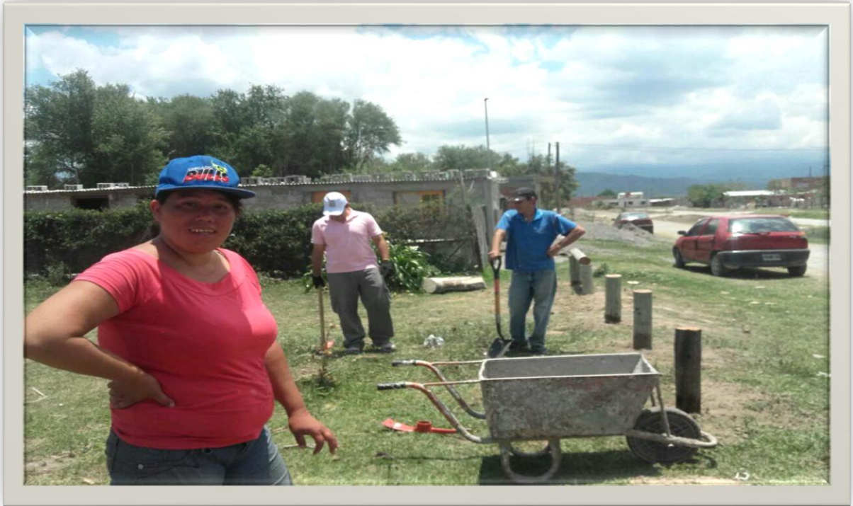
Miembros de la comisión de limpieza y mantenimiento de la plaza. Atocha I