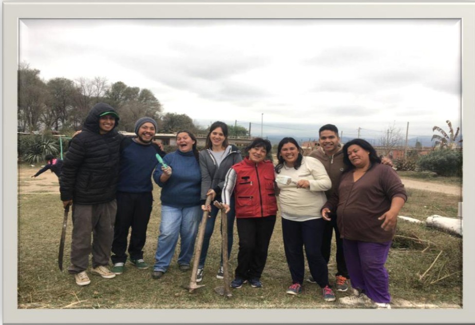
Equipo de la M.de T. Atocha I.