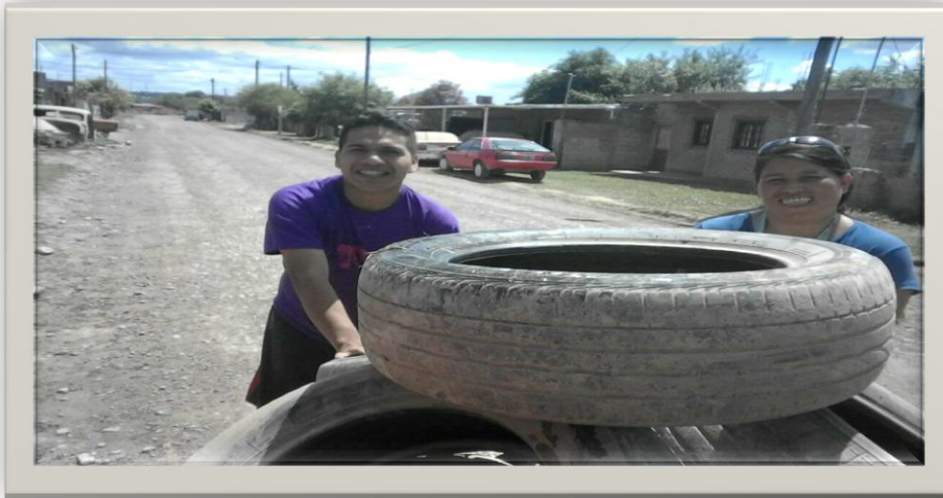
Recolección de los neumáticos para el remodelamiento de la plaza. Atocha I.