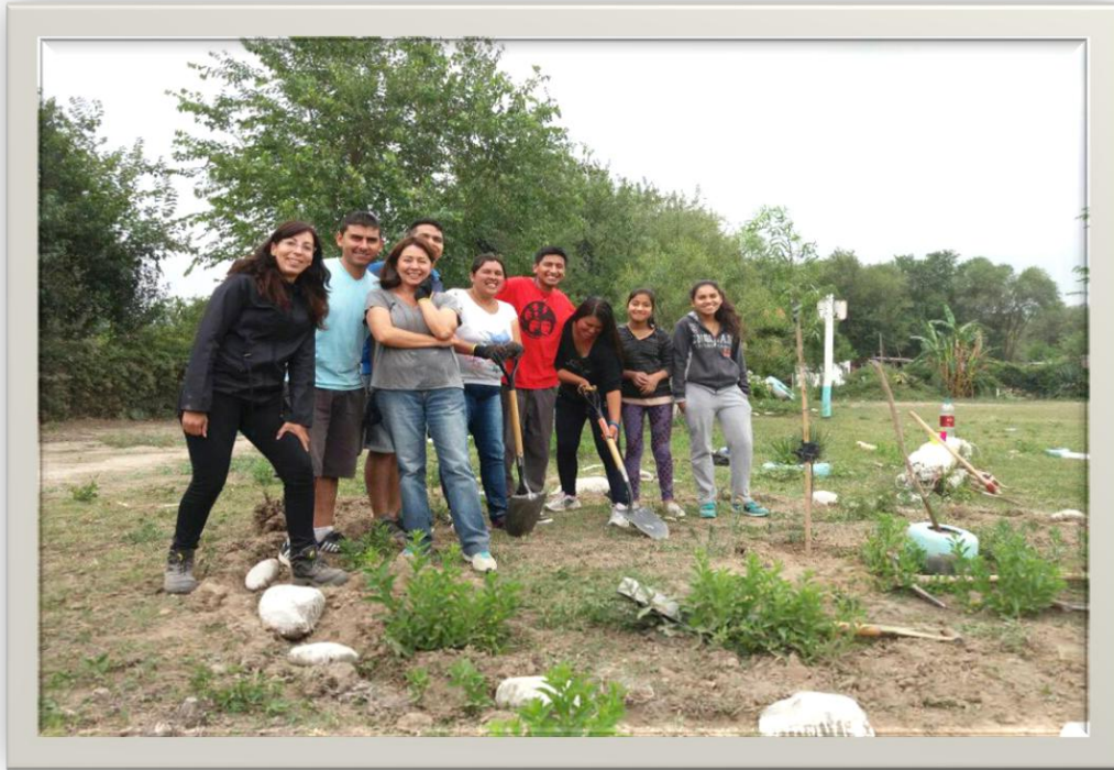
Equipo técnico y social de Pro.Me.Ba y los integrantes de la M. de T. Atocha I.