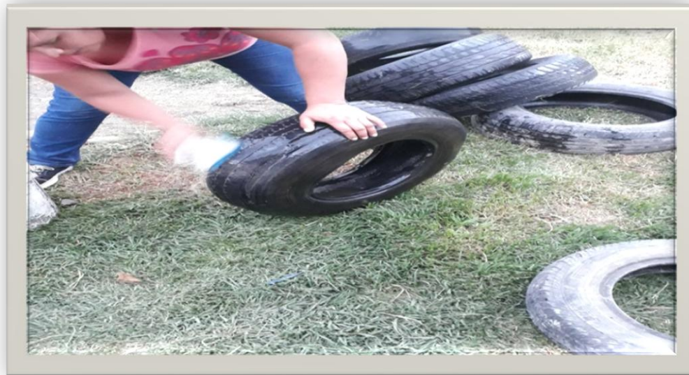
Comisión de limpieza y mantenimiento de la plaza. Atocha I.