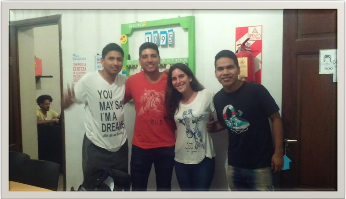
Equipo de coordinación de: M. de T. Zonal y H.S (Habilitación Social). TECHO.