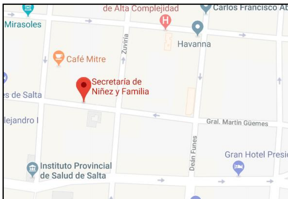
Ilustración 2. Ubicación de la Secretaría de Niñez y Familia

El objetivo del PFFYC es: “abordar integralmente a las problemáticas de las familias en situación de riesgo de desintegración y/o disfuncionalidad; promoviendo el desarrollo de las capacidades individuales y grupales con el objeto de generar sujetos activos y autónomos en la resolución de las problemáticas familiares”. (Secretaría de Promoción de Derechos Ministerio de Desarrollo Humano, 2011).