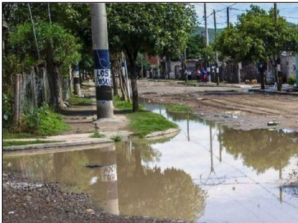
Ilustración 4. Esquina del Bº San Benito

La familia reside en el Bº San Benito, ubicado en la zona sudeste de la Capital. Es un barrio cuyas calles no se encuentran asfaltadas.