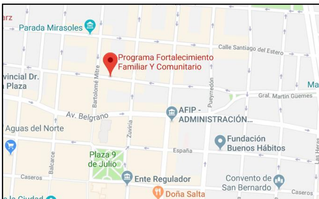
Ilustración 1. Ubicación del Programa Fortalecimiento Familiar y Comunitario

El PFFYC se encuentra en la Secretaría de Niñez y Familia, perteneciente al Ministerio de la Primera Infancia. Está ubicado en el micro-centro de la ciudad de Salta. Su dirección es General Güemes N° 562, y el horario de atención al público es de lunes a viernes de 9:00 a 20:00 horas, al igual que el de la Secretaría de Niñez y Familia (Secretaría de Promoción de Derechos - Ministerio de Desarrollo Humano, 2011)