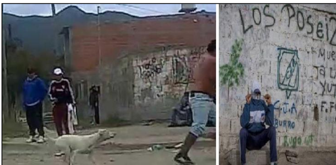
Ilustración 5. Calles del Bº San Benito

Esta zona está densamente poblada de jóvenes y adolescentes y se caracteriza por la gran cantidad de patotas que durante los fines de semana se enfrentan constantemente entre sí y con la policía.