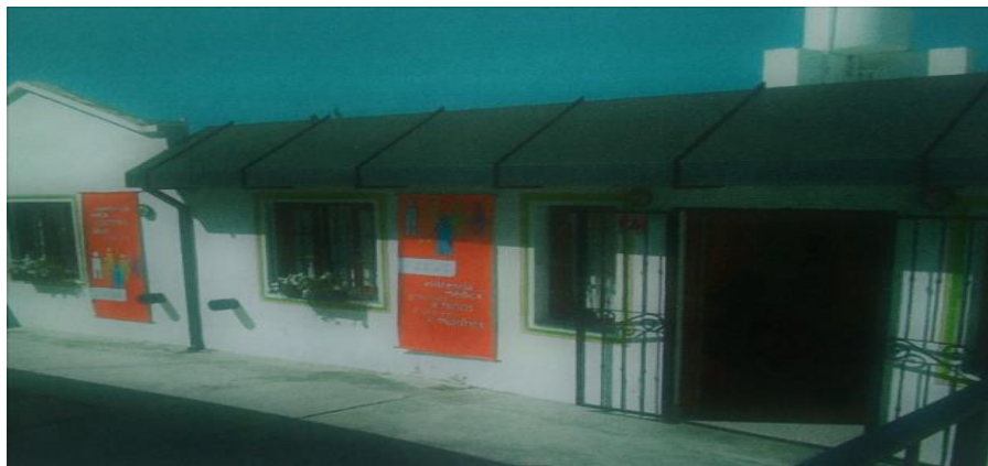
Figura N°2: foto de la Fundación por Nuestros Niños

Fuente: sacada por una cámara de unas de las residentes de Trabajo Social en mayo de 2017