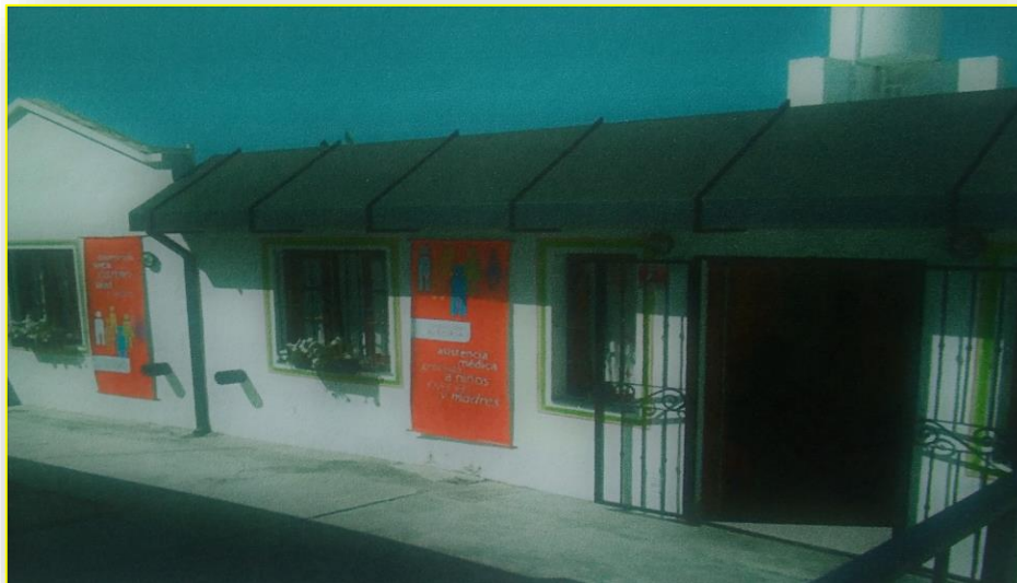
Figura 2: Foto de la Fundación Por Nuestros niños.

Fuente:Foto provista por residentes anteriores de la Fundación.