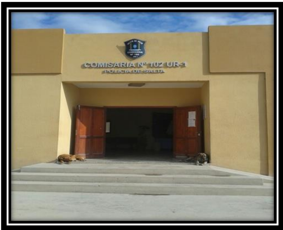
Ilustración 7 Comisaría N 102