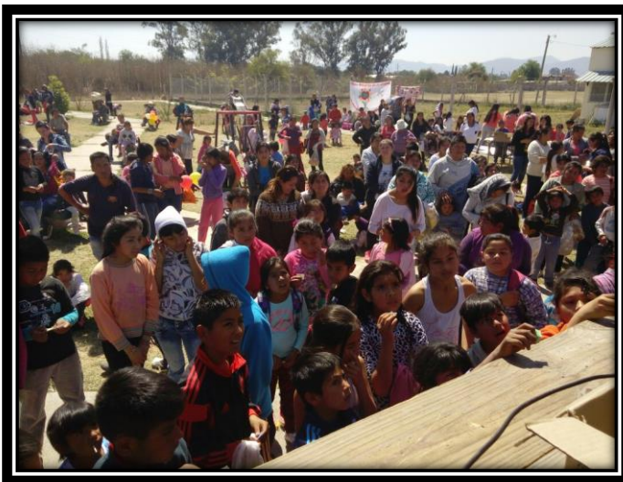
Ilustración 19 Convocatoria Día del niño