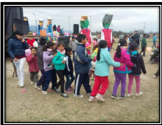
Ilustración 16 Show de la Batucada en la Feria