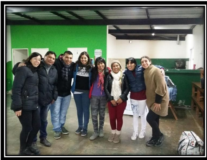
Ilustración 27 Equipo de campo PROMEBA