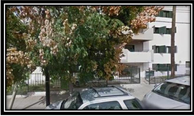
Ilustración 3 UEP Oficina ubicada en la calle Santiago de Estero 2245