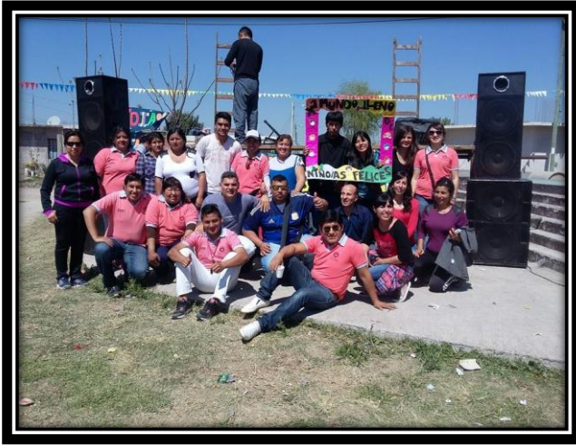
Ilustración 20 Participantes del festejo día del niño