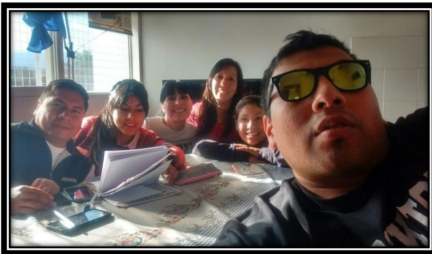
Ilustración 24 Supervisión de referente