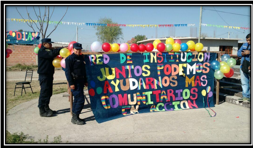
Ilustración 23 Preparación del escenario festejo día del niño