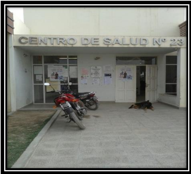
Ilustración 6 Centro de Salud N° 23