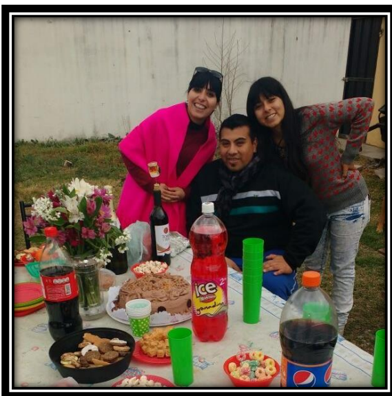
Ilustración 25 Festejo de la Pachamama