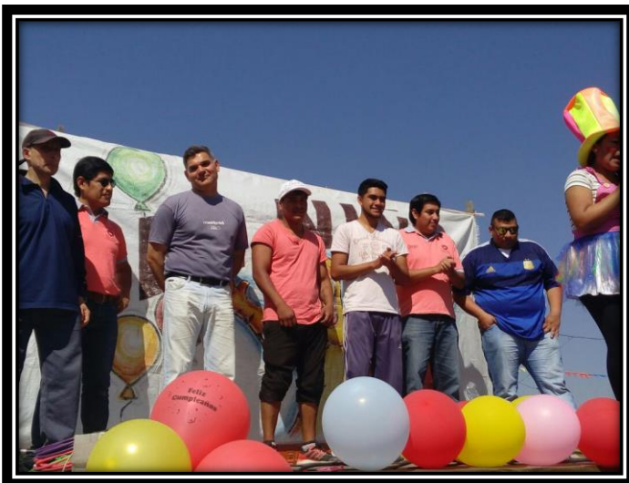
Ilustración 22 juegos en el festejo día del niño