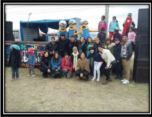
Ilustración 17 Participantes de la feria Comunitarios en Acción