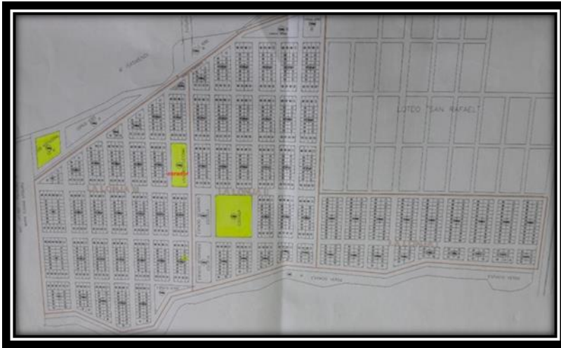
Ilustración 1 Plano dividido por manzanas, de la comunidad de Atocha I, II y III