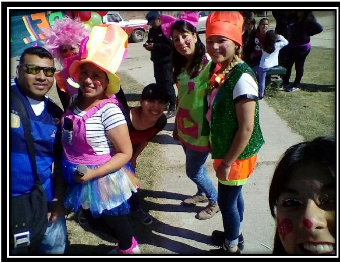
Ilustración 21 Equipo de campo PROMEBA