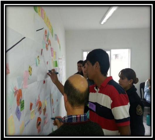
Ilustración 9 Referentes institucionales realizando un mapeo