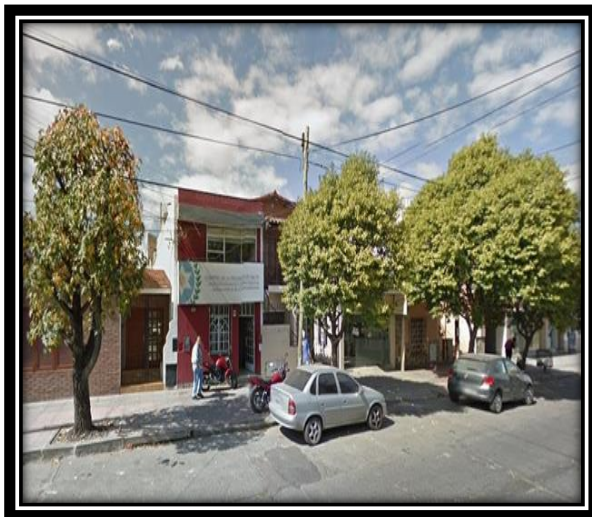
Ilustración 2 Secretaria de Vivienda y Hábitat- Alvear 514