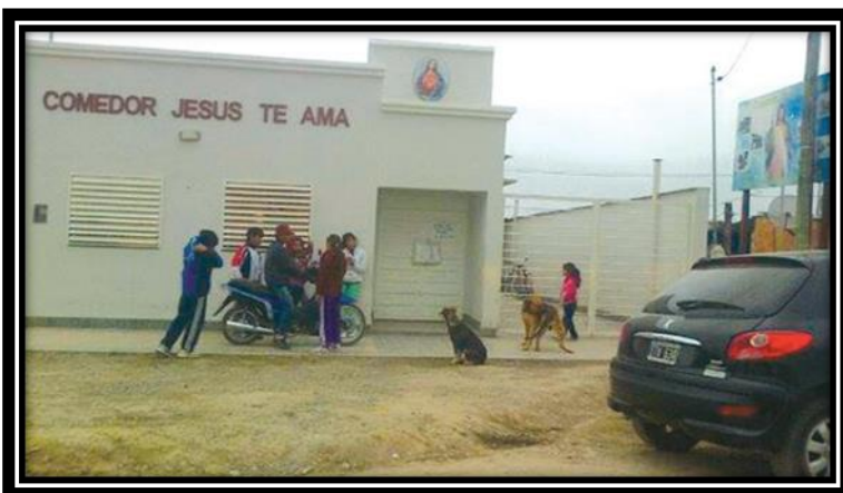
Ilustración 5 Comedor Jesús te Ama