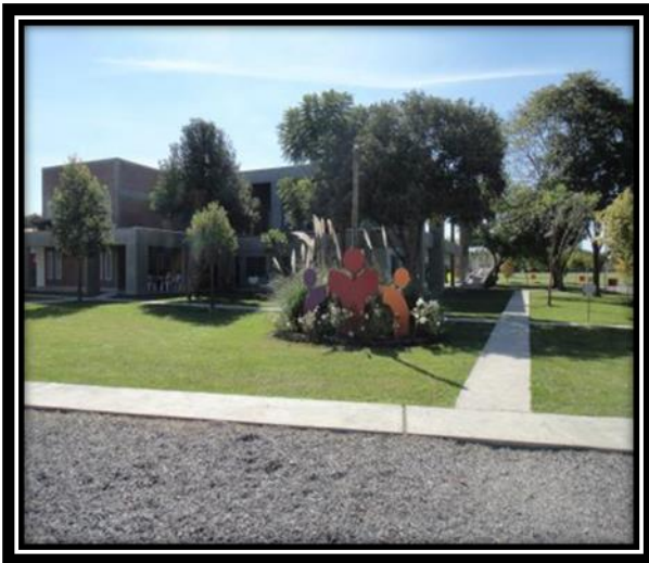
Ilustración 4 Fundación Anawin