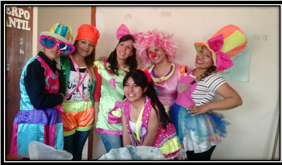
Ilustración 18 Festejo día del niño