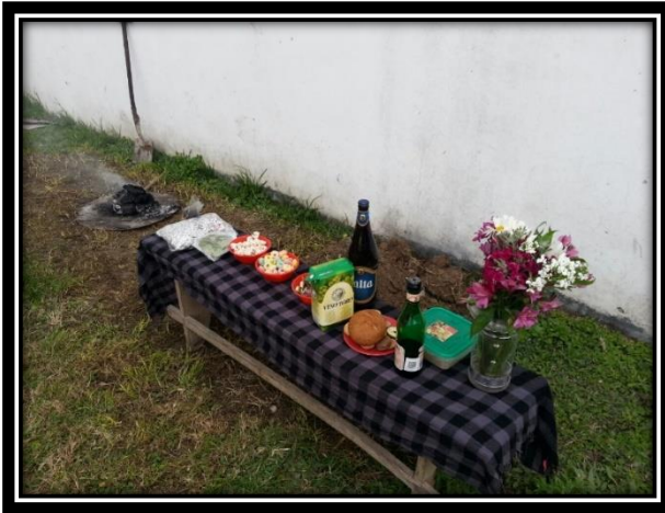
Ilustración 26 Ofrendas del festejo de la Pachamama