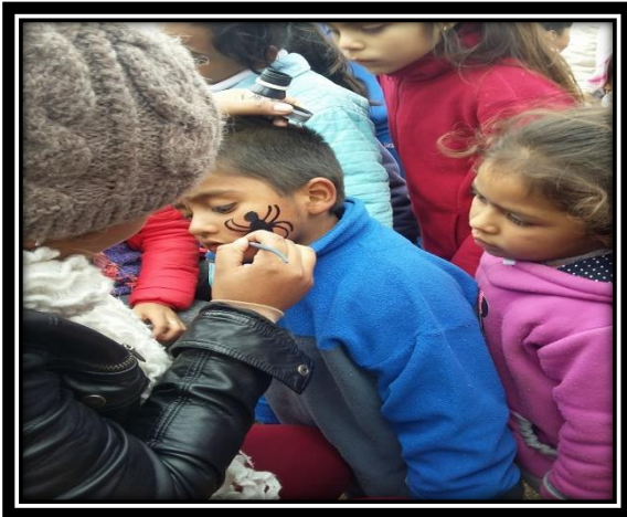
Ilustración 15 Actividades de la feria