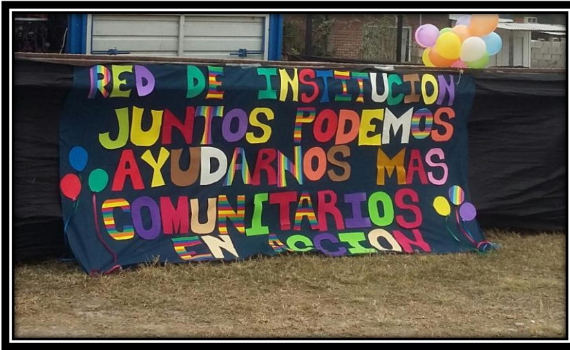
Ilustración 14 Cartel de la feria Comunitarios en Acción