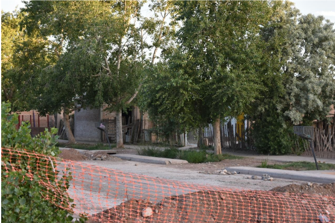
Foto 26: En la zona el avance de obras permite visualizar una mayor limpieza y prolijidad. En esta foto se puede observar la preocupación de los vecinos en mantener espacios con plantaciones que garanticen la sombra en el verano.

De acuerdo a las referencias de los entrevistados “estas construcciones las hacen porque el año próximo hay elecciones, entonces hacen buena letra, después se van y se olvidan. Ahora está todo parado, trabajan unos días y después te dejan las cosas colgadas, con el material tirado. Después la gente roba” .