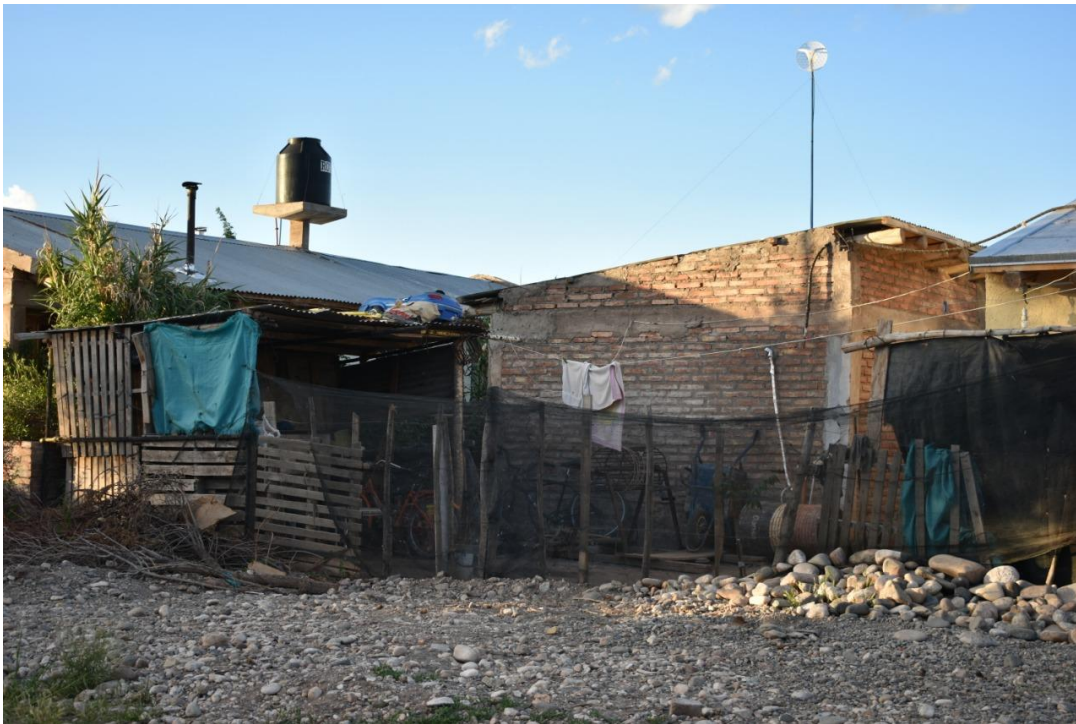
Foto 14: Una de las características más repetidas es la convivencia de construcciones de ladrillos y los cierres perimetrales que denotan la situación de pobreza familiar.