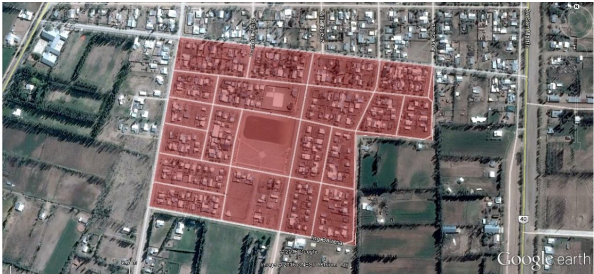
Foto 3: Imagen satelital del Barrio Nueva Esperanza.