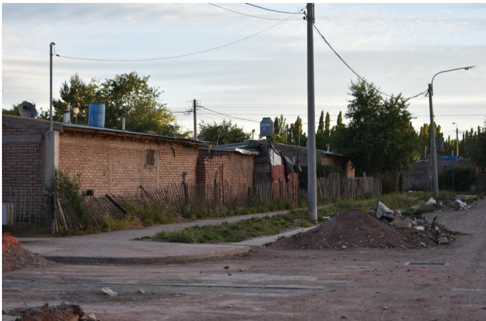
Foto 25: Algunas de las zonas barriales que ya cuentan con un importante avance en las obras de urbanización.