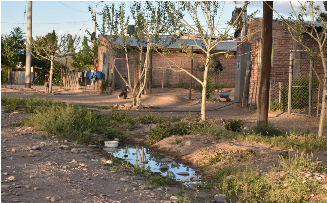
Foto 19: El problema de la acumulación de agua en acequias construidas manualmente y sin supervisión municipal, se convierten en focos de enfermedades.