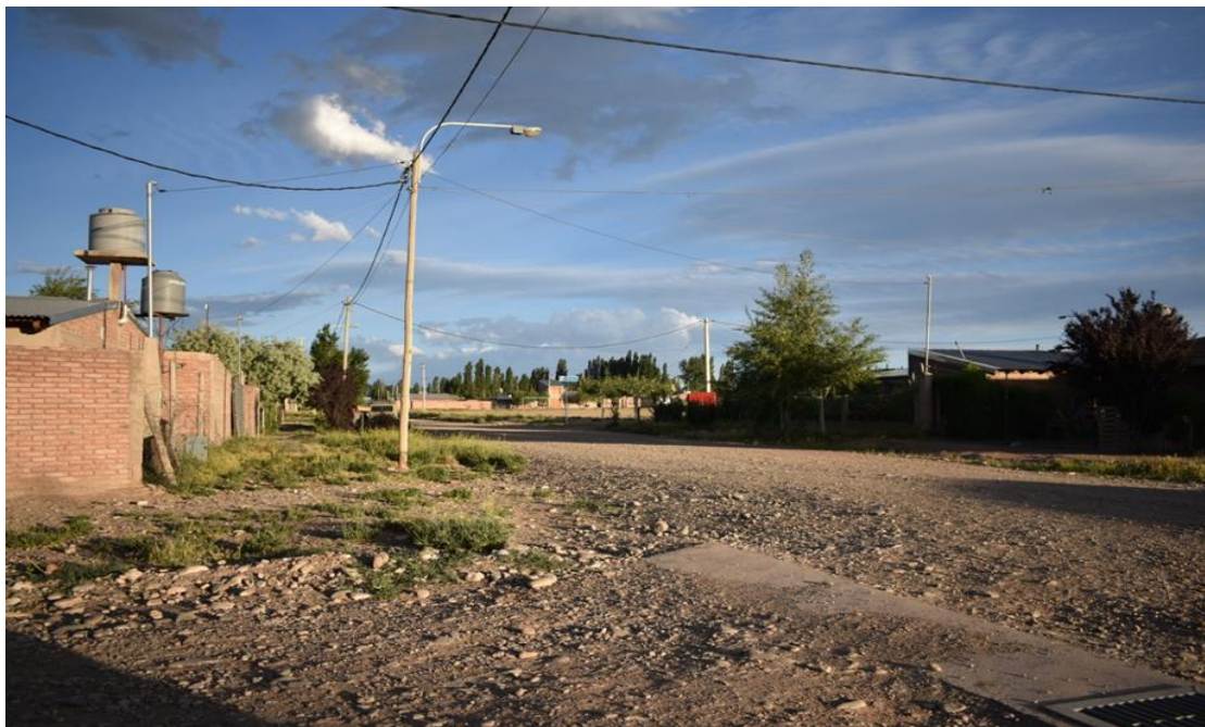
Foto 20: Se observa la continuidad entre la calle y la vereda la cual se diferencia tenuemente por los cordones de esquina. El barrio se encuentra en proceso de urbanización pero el mismo es lento.