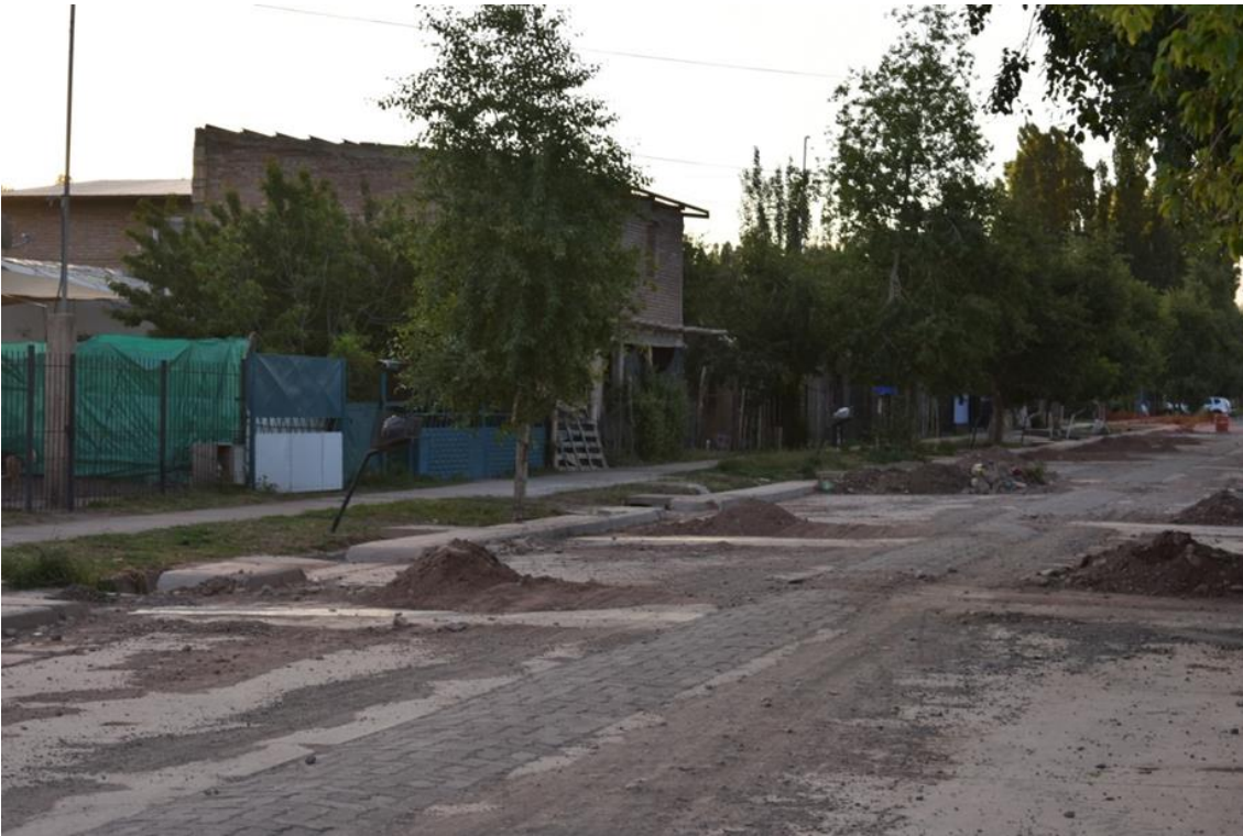
Foto 27: Esta imagen muestra el importante avance de las obras sobre todo de pavimentación, construcción de acequias, cordones en las veredas y puentes.