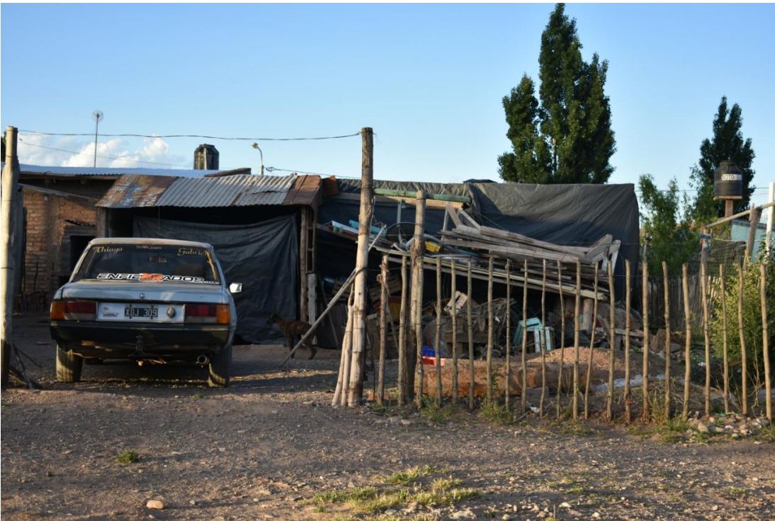
Foto 15 y 16: Se observa en la mayoría de las viviendas cierres perimetrales paupérrimos y muy vulnerables.