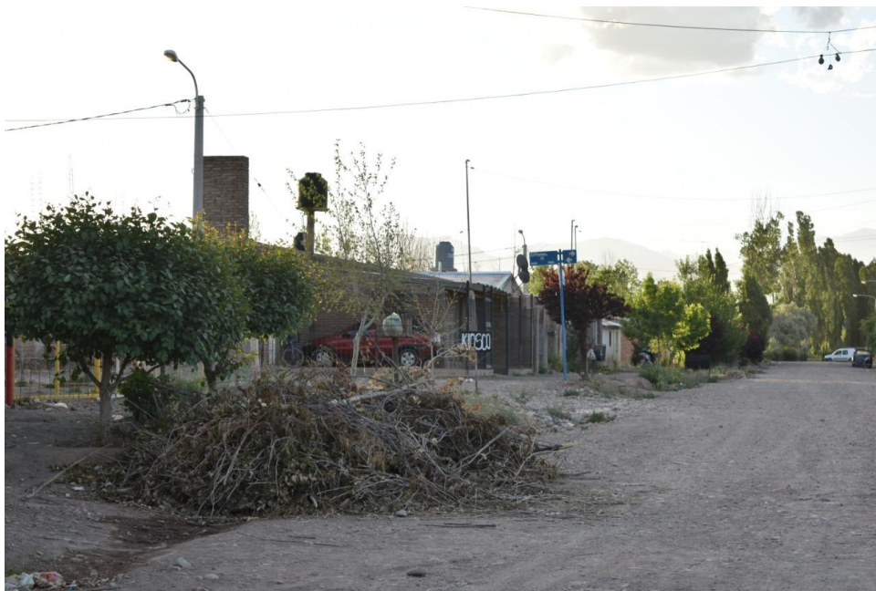
Foto 12: La acumulación de basura ecológica es característica. Esta también es una práctica observada en las zonas rurales, donde este tipo de material es utilizado para la calefacción. Es probable que éste sea el destino para el cual se ha acumulado en la orilla de la calle.

“Los reclamos a la municipalidad son constantes entre ellos la renovación de lámparas y focos en los postes de luz, los que suelen ser rotos por los jóvenes, sobre todo los que andan en la plaza sin hacer nada, así sin luz la policía no los puede ver y hacen lo que quieren” (Presidenta de Unión Vecinal)