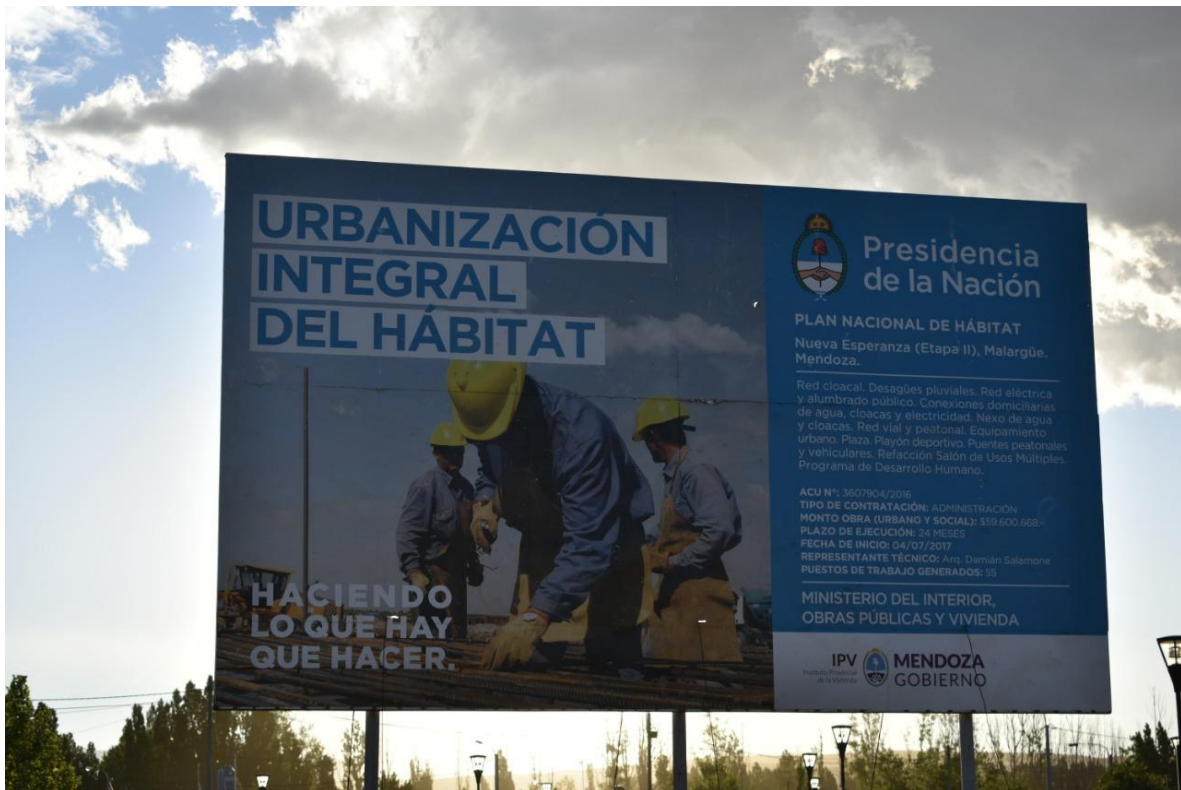
Foto 9: Trabajos para mejoramiento urbano del barrio.