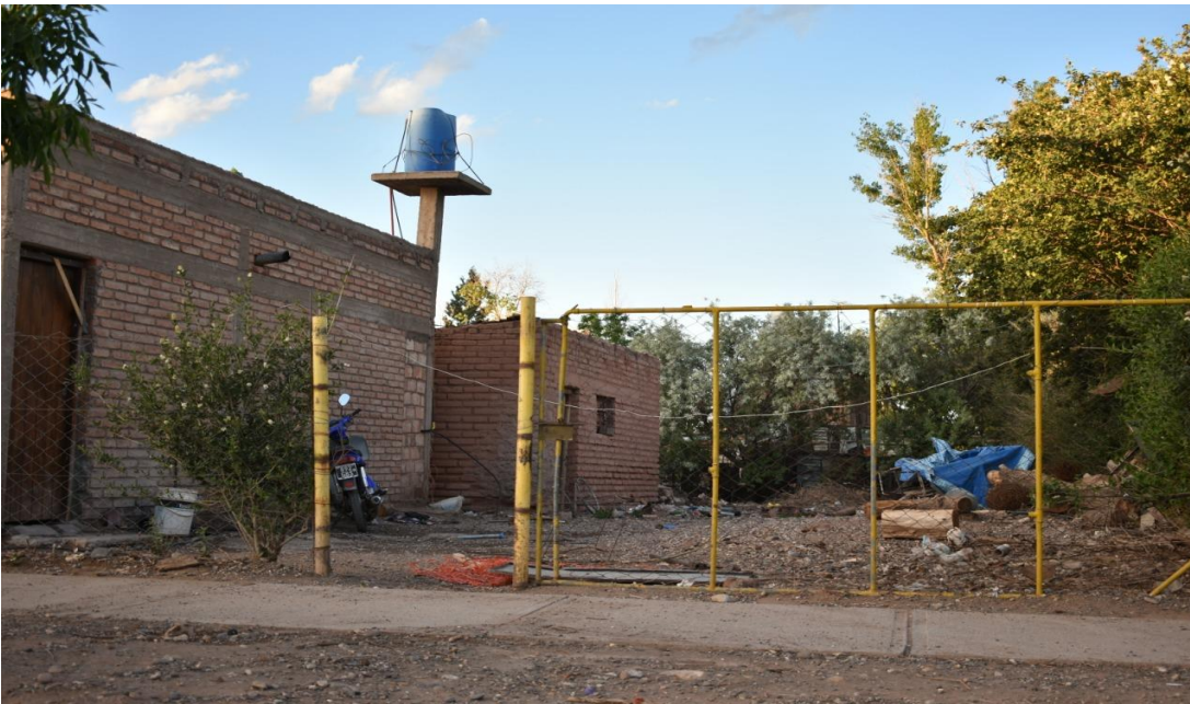
Foto 17: Algunas de las dificultades de las viviendas se vincula con la acumulación de basura y la falta de condiciones de seguridad en los cierres perimetrales.