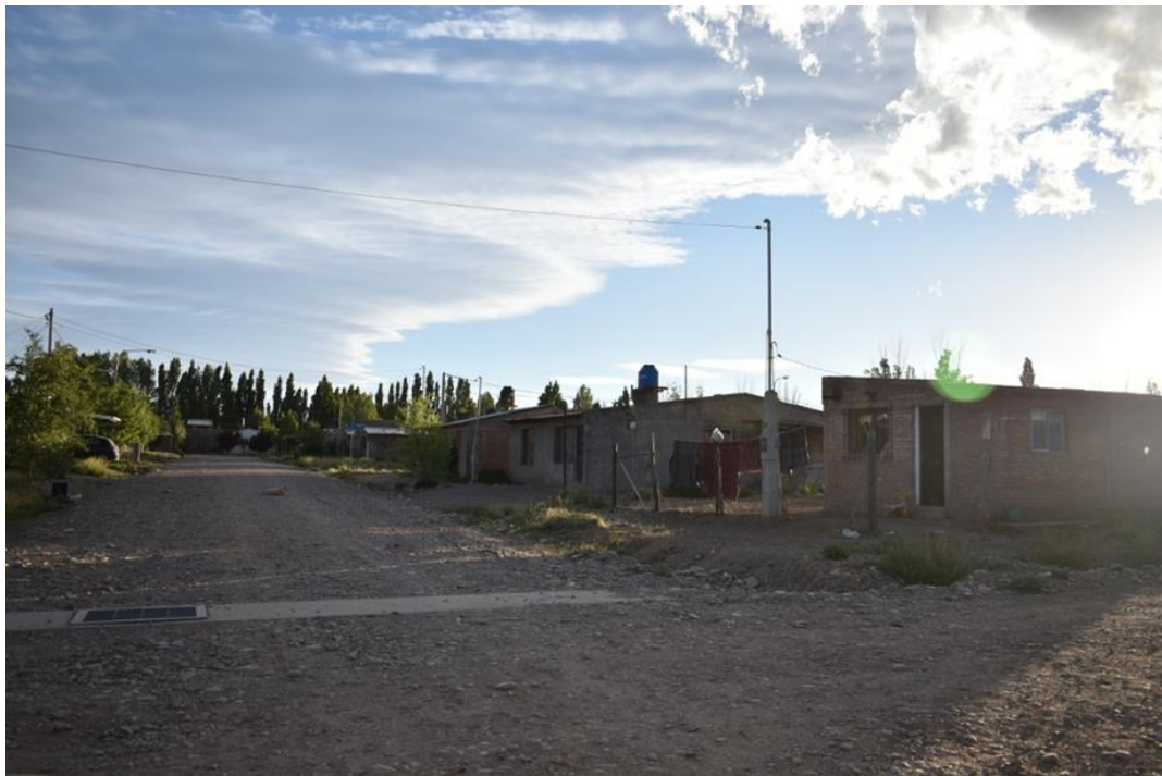
Foto 1: Acceso al barrio Nueva Esperanza.

Carece de veredas y rampas, el acceso a las viviendas se realiza por calle de tierra, diferenciándose la vía vehicular de la peatonal, existen carteles nomencladores en todas las intersecciones de las calles, indicando el nombre y la numeración de las mismas. Se observan cordones en el margen Norte del barrio. Presenta alumbrado público parcial.