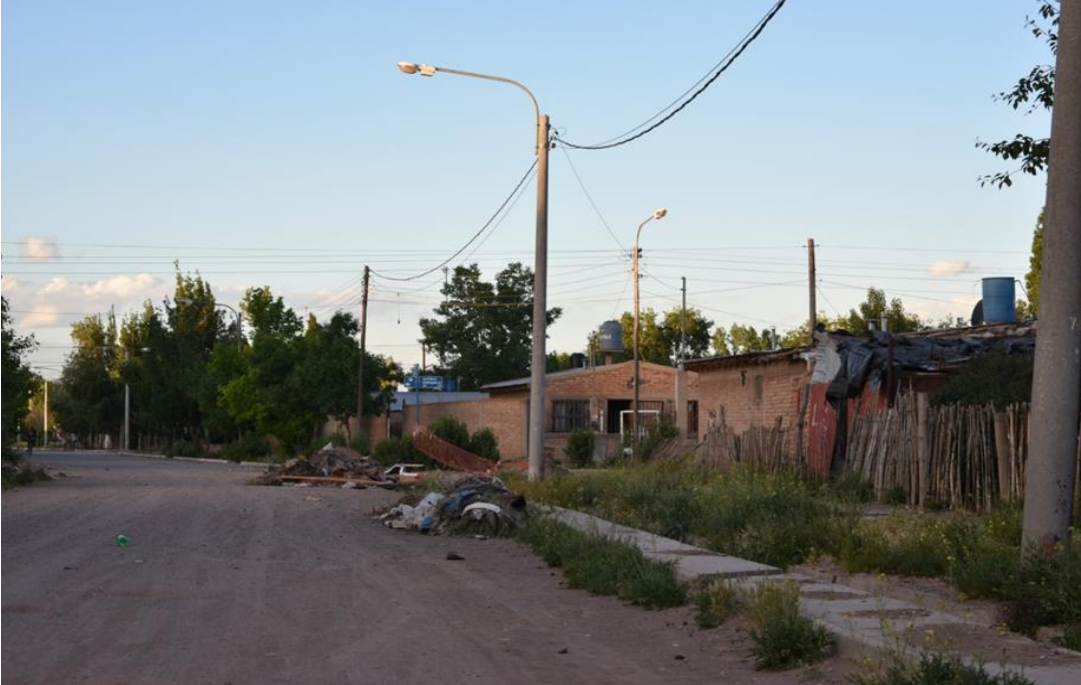
Foto 13: Es habitual observar restos de residuos en las calles.

En su mayoría se observan viviendas en condiciones de pobreza aunque aparecen indicadores de mejoras muy lentas como son los ladrillos acumulados en algún rincón, caños estructurales y otros materiales destinados a la construcción.