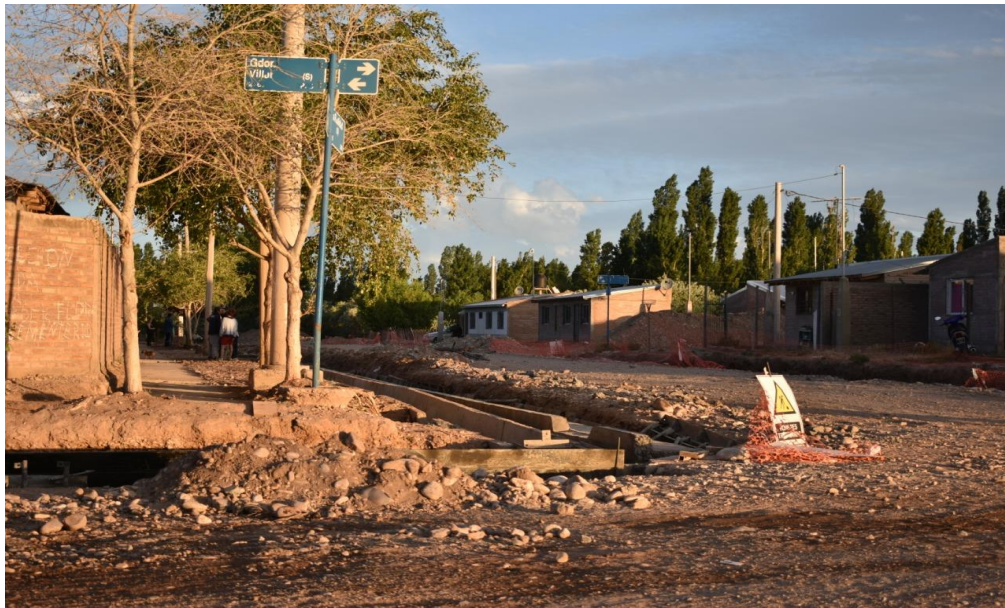
Foto 24: En algunas zonas se observa la intervención estatal que ha comenzado con la urbanización al construir las acequias necesarias para el drenaje de agua, y la delimitación de veredas, postes de luz y arbolado público.