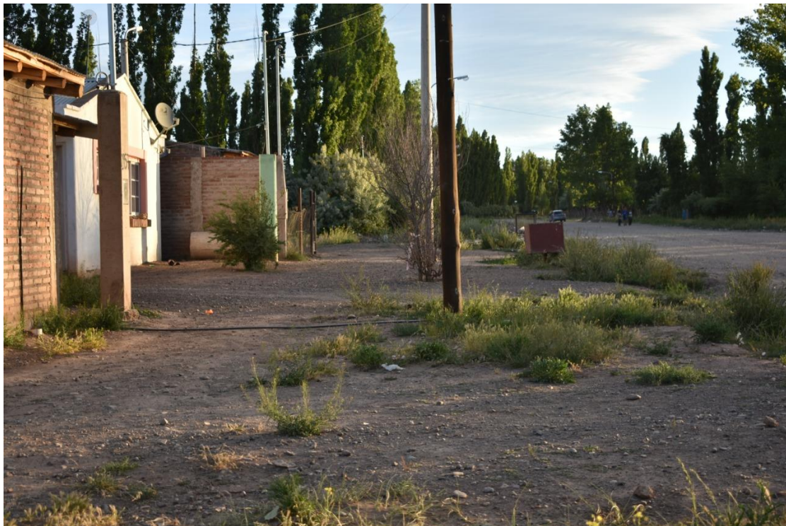
Foto 18: Se observa que no se han construido las cunetas ni puentes de ingreso a las viviendas. Las veredas de tierra, presentan una continuidad con las calles en muchas de las manzanas.

El barrio ha tenido un crecimiento lento pero sostenido. Durante muchos años sólo se han delimitado las calles a partir de las instalaciones de gas, pero no se contaba con veredas y acequias, las cuales son necesarias para drenar agua y para transportarla para riego. Las calles presentaban una continuidad hacia el ingreso de la vivienda, sólo separadas por el poste de luz particular. Sin embargo los reclamos siguen pendientes.