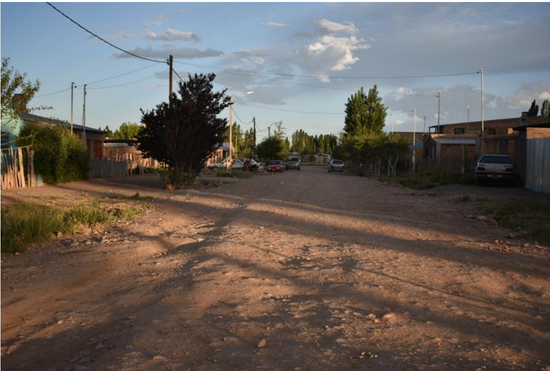
Foto 29: En la imagen se observa el arbolado que no ha sido planificado y se va conformando paulatinamente.

La población económicamente activa se dedica a la agricultura, la cría de ganado, empleados públicos y empleos temporales. Muchas mujeres realizan actividades de servicio doméstico