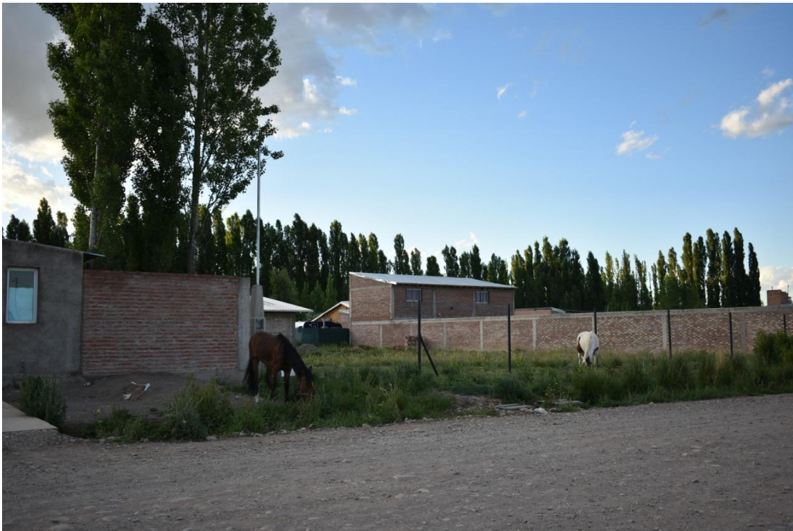
Foto 23: La convivencia con el caballo es una práctica rural que se traslada a la ciudad en barrios urbano-marginales

El barrio muestra una mejora en la construcción de infraestructura como es la pavimentación de calles, la construcción de las cunetas y puentes, lo que le otorgará una imagen más favorable.