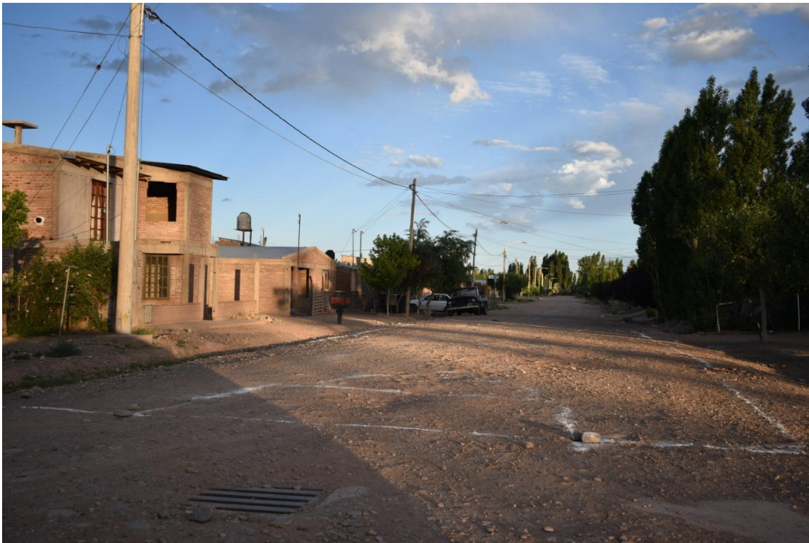
Foto 22: Muchas construcciones muestran un mayor poder adquisitivo y sus propietarios se han ocupado de marcar acequias y límites con las calles.

Se pueden observar caballos en las viviendas los que suelen estar sueltos. “Los caballos los usan para salir al campo cuando salen a cazar liebres y otros animales, también los tienen para carreras cuadreras que organizan ellos mismos” Refiere un vecino de la zona.