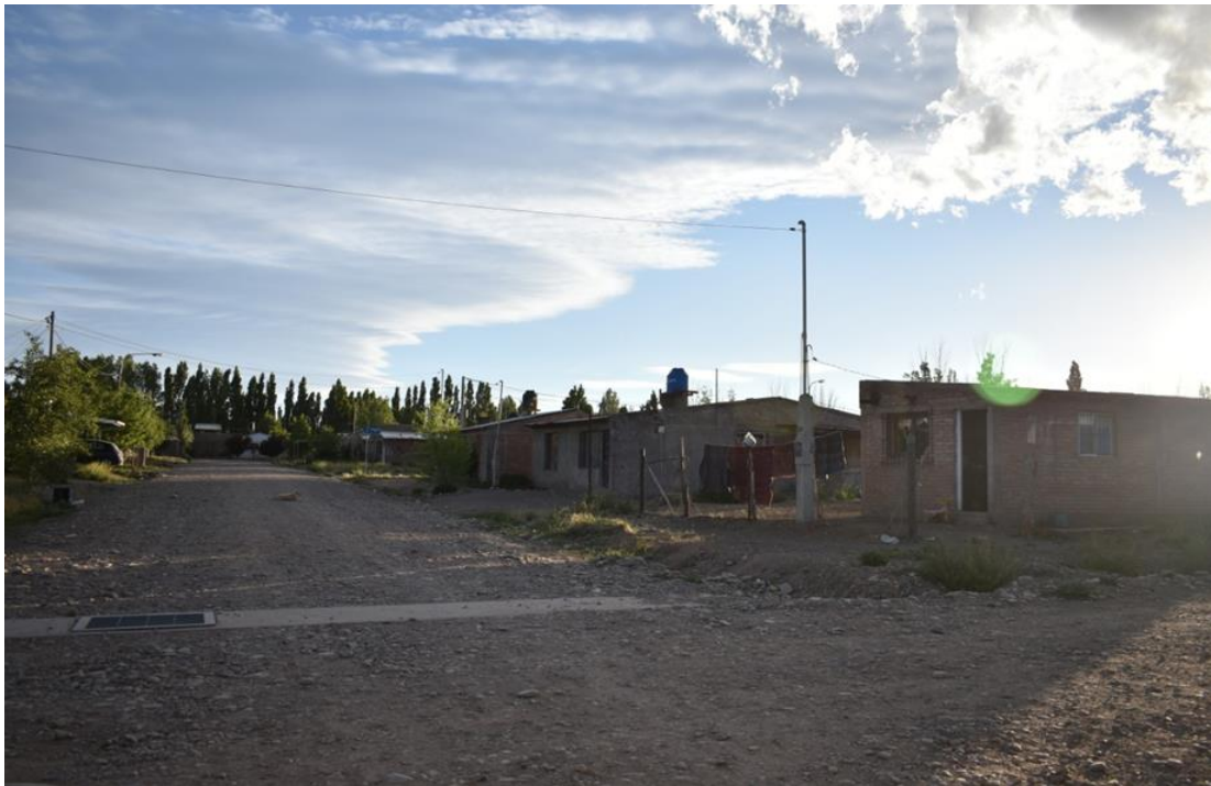
Foto 21: Algunas zonas se encuentran con acequias que han sido construidas por los habitantes.

En el barrio conviven diferentes clases sociales. Se observa una clase media trabajadora con un mayor poder adquisitivo que les permite la construcción de viviendas en mejores condiciones de mantenimiento y diseño, aunque de lento crecimiento, sobre todo en algunas manzanas en las cuales los vecinos han construido las acequias marcando una delimitación con la calle.