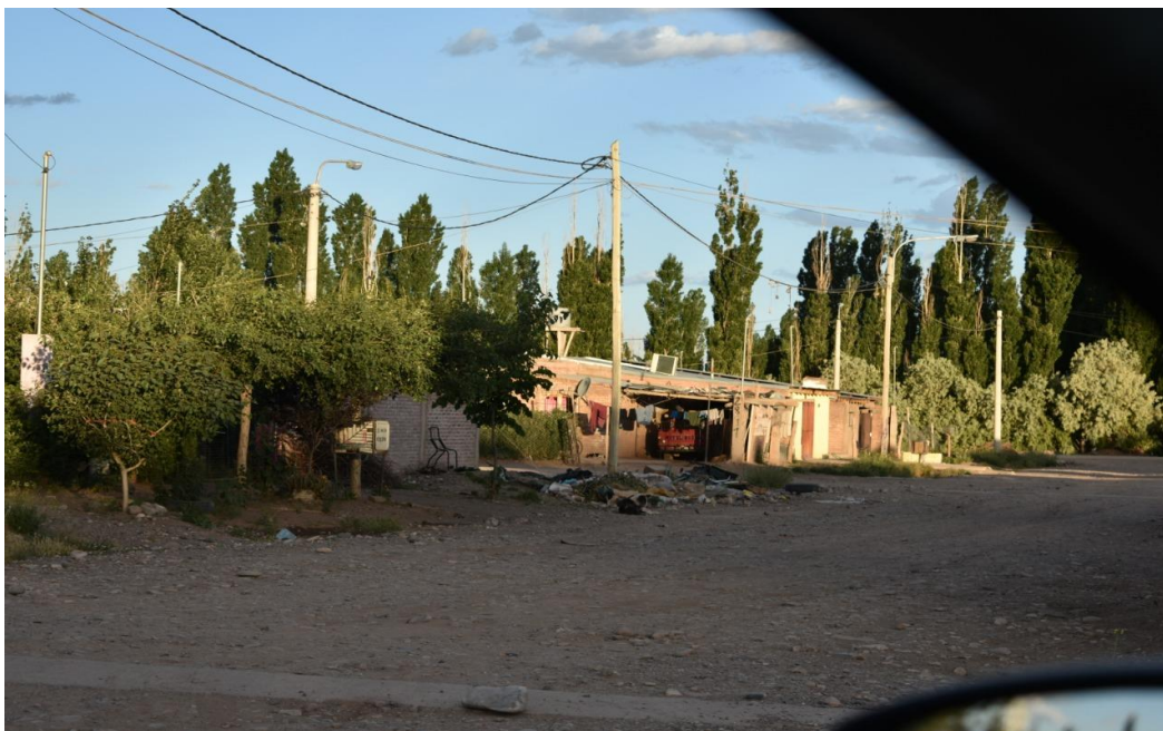
Foto10: En la imagen se puede apreciar cómo la construcción de material sismo resistente, convive con construcciones de adobe y techo de madera y paja, clásica de las viviendas rurales de la zona.

El Barrio Nueva Esperanza está compuesto por familias con ambos cónyuges y sus hijos, o familias ensambladas. Estas familias proceden en su mayoría, de zonas rurales quienes han mantenido las estrategias de supervivencia rural.