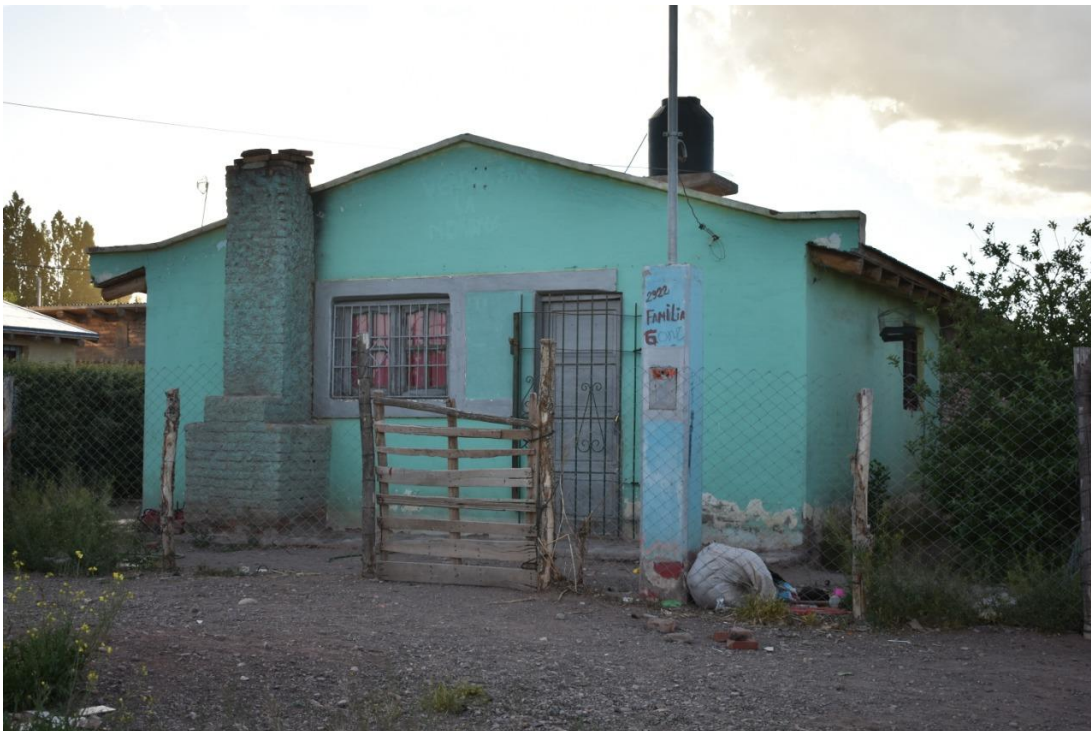
Foto 11: La construcción de la casa permite observar cómo algunas familias han resuelto el problema de la calefacción al construir chimeneas. Los inviernos son especialmente largos y muy fríos en la zona.

Así las viviendas presentan la infraestructura de la ciudad conviviendo con las características de viviendas rurales. Se observan casas sismo resistentes, con diseños típicos de barrios urbanos, pero con cierres perimetrales realizados con caña, o ramas, y eventualmente algunos con tela de alambre.