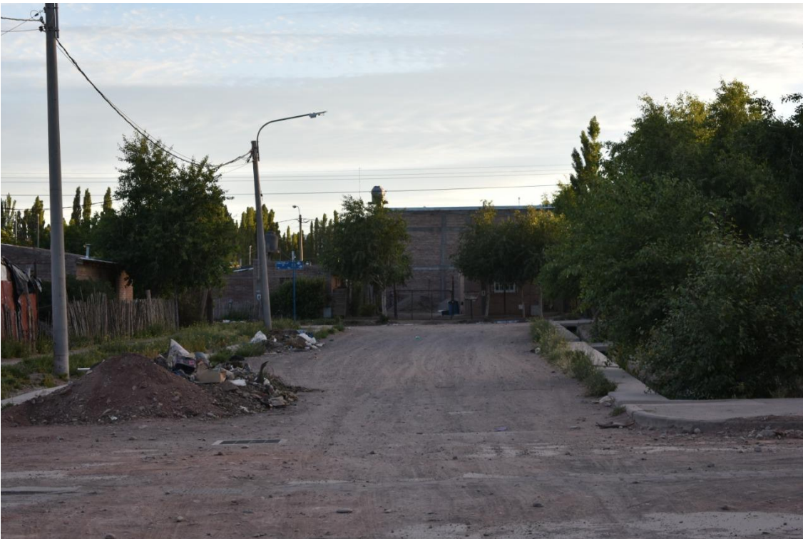
Foto 28: El avance de obras desde otra perspectiva.

El arbolado público no se encuentra planificado. “Los árboles los encontrás en cualquier parte, en la vereda, incluso en la calle. También los talleres de autos o motos, o incluso hacen asados en la vereda. Esa vereda y calle es como parte del campo, una extensión de las casas que no tiene límites” , refiere el dueño de un kiosco del barrio.