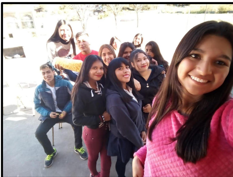
Actividades lúdicas-recreativas en recreos