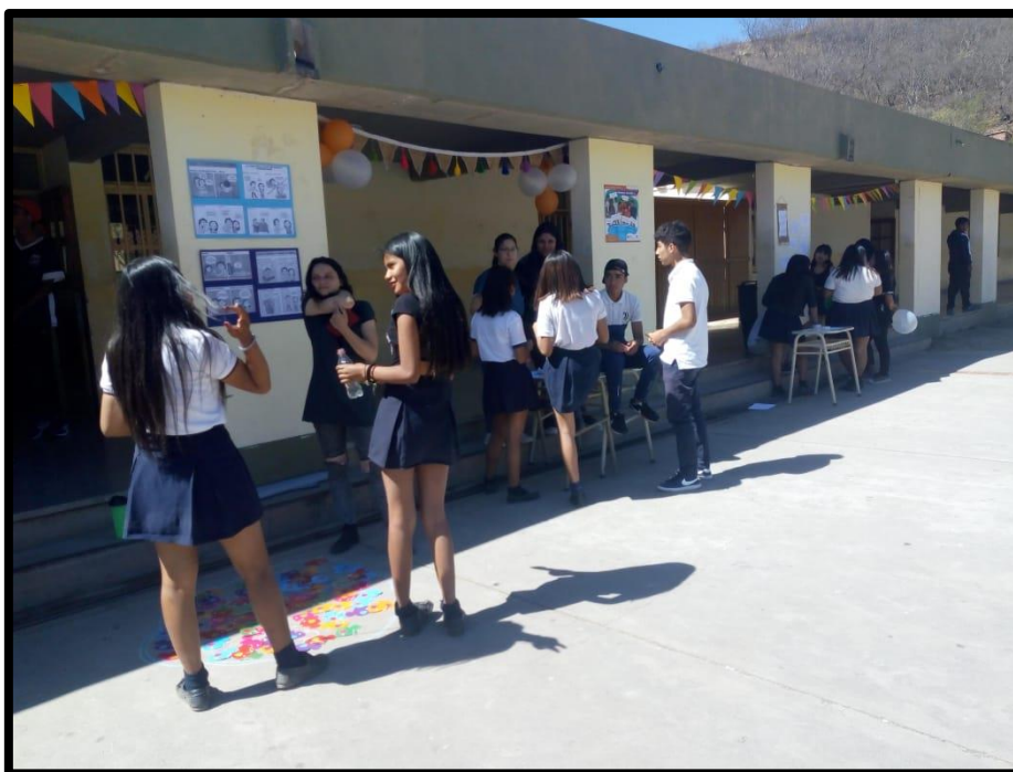
Feria de la salud: “Kermes: Amor... del bueno?”