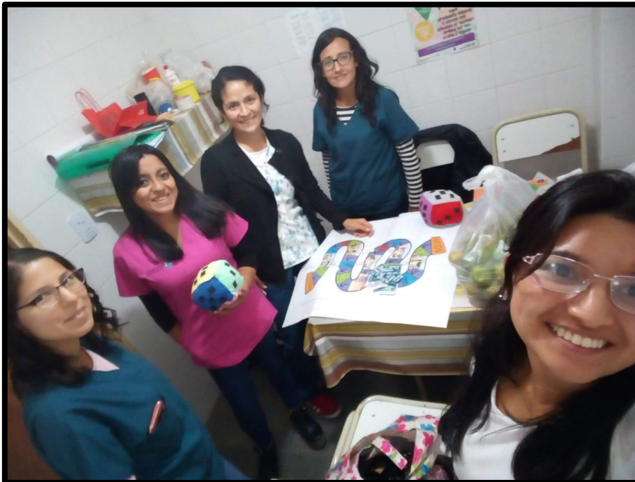
Equipo Asesor: Asesoras y residentes

A continuación, se presentan fotos de algunos momentos transcurridos en la práctica pre-profesional: