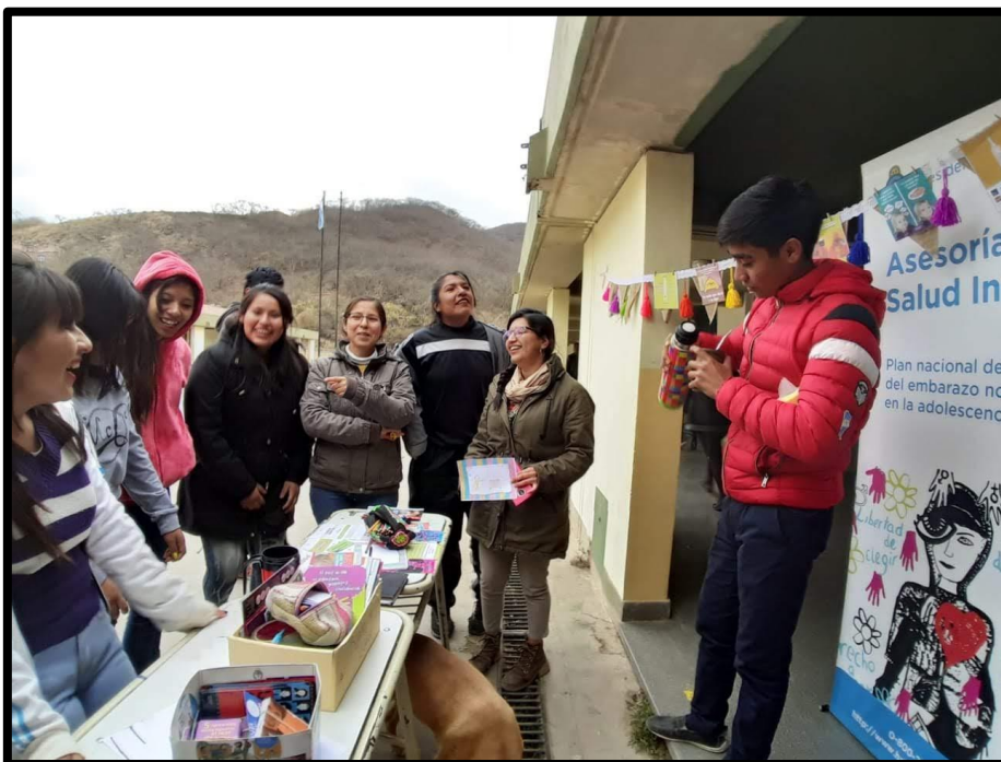
Día Mundial de la SSyR