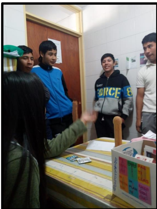
Jóvenes en ASIE