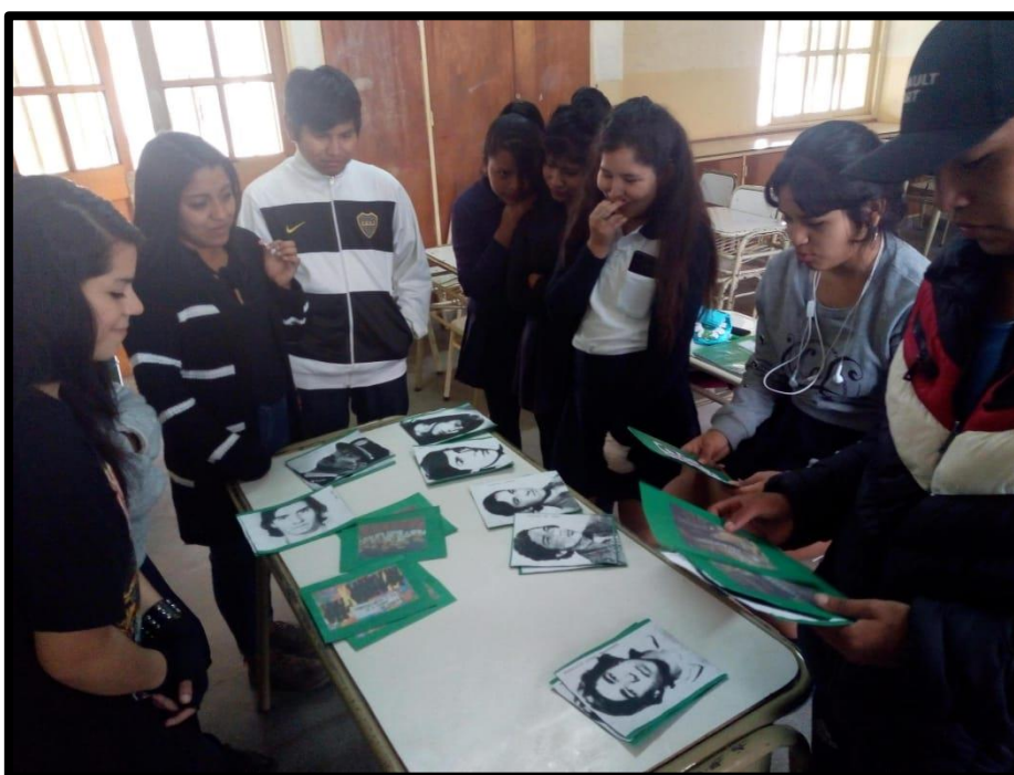
Día Nacional de la Juventud