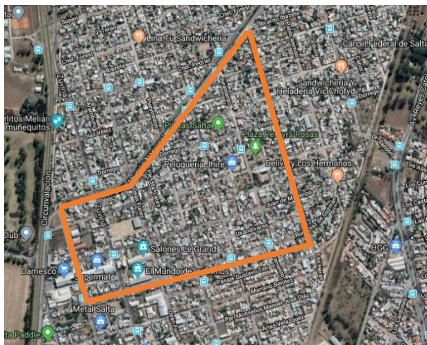
Ilustración 2, B° Miguel Ortiz

En dichas instituciones los y las estudiantes de quinto año de Trabajo Social se insertan en el Equipo de Orientación Escolar conformado por un Pedagogo, una Fonoaudióloga, y una Psicóloga, acompañados su vez por los miembros del equipo de la fundación conformado