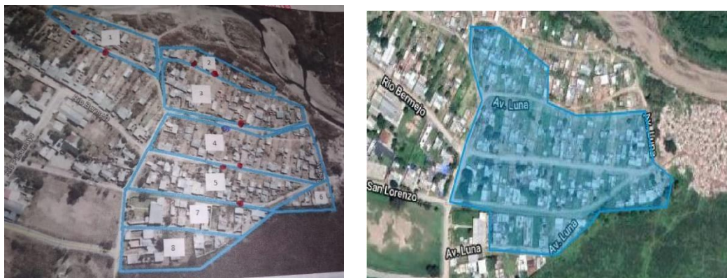
Ilustración 1 Mapa del Asentamiento la Ciénaga extraído del Registro Nacional de Barrios Populares

En el barrio pueden observarse dos opuestos, por un lado, un sector regularizado que cuenta con acceso a servicios de luz, cloaca, agua por red y gas natural, y, por otra parte, con un sector que puede ser denominado como un “asentamiento espontáneo”, o mejor dicho como un barrio popular, en proceso de regulación dominal.