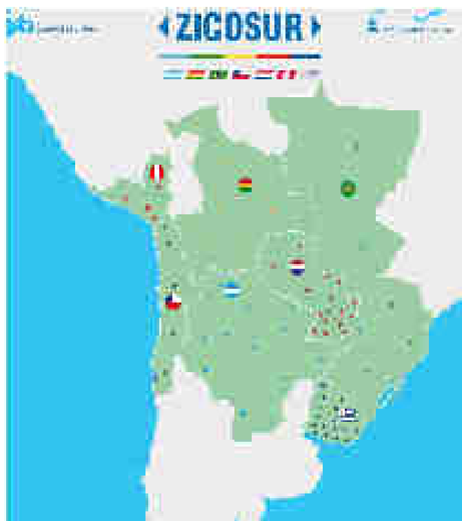
Ilustración 1: Mapa de zonas que componen ZICOSUR