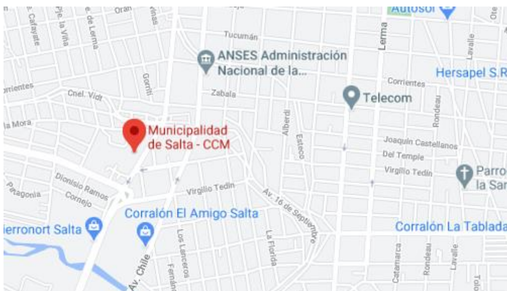
Ilustración 1: Mapa de la ubicación de la Municipalidad de Salta

La municipalidad de Salta se encuentra en Av. Paraguay 1240, Ciudad de Salta, Provincia de Salta, Argentina.