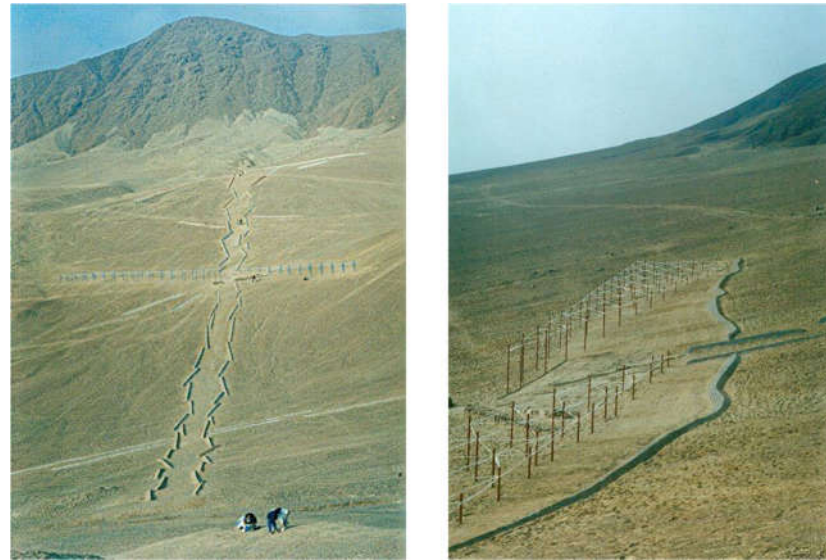
Fig. 1. Izq. Ejercitaciones del Taller Integrado Tierra, Agua, Aire, Fuego, coordinado por José Balcells, 1994. Der. Ejercitaciones del Taller Integrado La Construcción del borde, Rolando Meneses y equipo, 1992

En el desierto aparentemente no hay nada. Sin embargo, el ojo atento que mira con interés los signos presentes en el territorio, revela una serie de preexistencias, obra de la naturaleza y de la mano del hombre: la presencia del agua, indexada en la erosión de la tierra y en los fósiles impresos en las rocas; la vida de los pueblos antiguos, presentes en los túmulos, en las construcciones circulares de Tulo, también en los pucarás de los Incas y en los fragmentos todavía visibles de la vía de conexión del imperio Inca, el qapac nam. Finalmente, en la explotación de las minas de salitre, que todavía yacen en las ruinas de las salitreras, y en los vestigios de los asentamientos industriales de las ciudades del salitre. Todo este conjunto de trazados, ruinas y vestigios del tiempo, toman los colores dorados del sol áureo e inmutable del desierto. Es en ese paisaje cultural que fue fundada la escuela de arquitectura de la Universidad Católica del Norte.